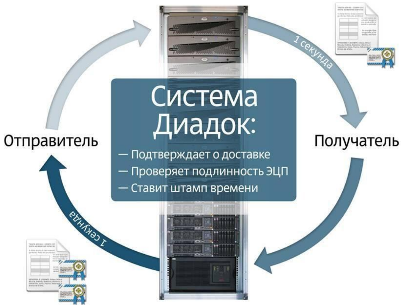
Схема работы с помощью ЭДО (Система Диадок)